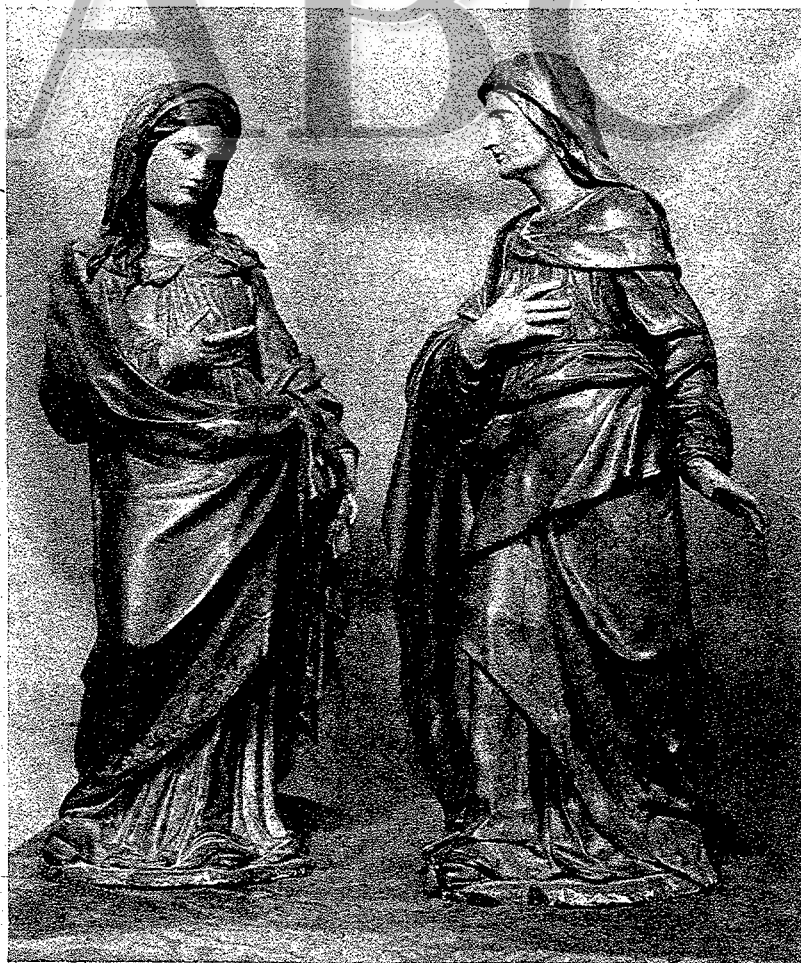
LA VISITACION, DEL CONVENTO DE SANTA PAULA, DE SEVILLA

Santa Ana, la Virgen y el Niño, las tres figuras en un solo misterio, cosa bien rara en la iconografía cristiana.