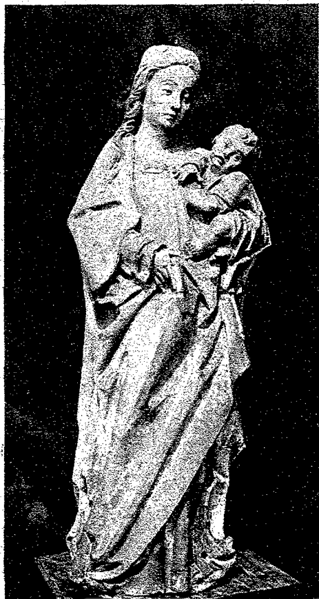
VIRGEN DE BARRO COCIDO. IGLESIA PARROQUIAL DE CAZALLA DE LA SIERRA

Está instalada la Exposición en la suntuosa iglesia el Divino Salvador, calificada por un esclarecido ingenio de Catedral del barroco, por sus inmensas proporciones y por el tesoro de aquel estilo que en ella resplandece. Y se debe a la feliz iniciativa del virtuoso e insigne prelado que dirige los destinos de la Iglesia en esta