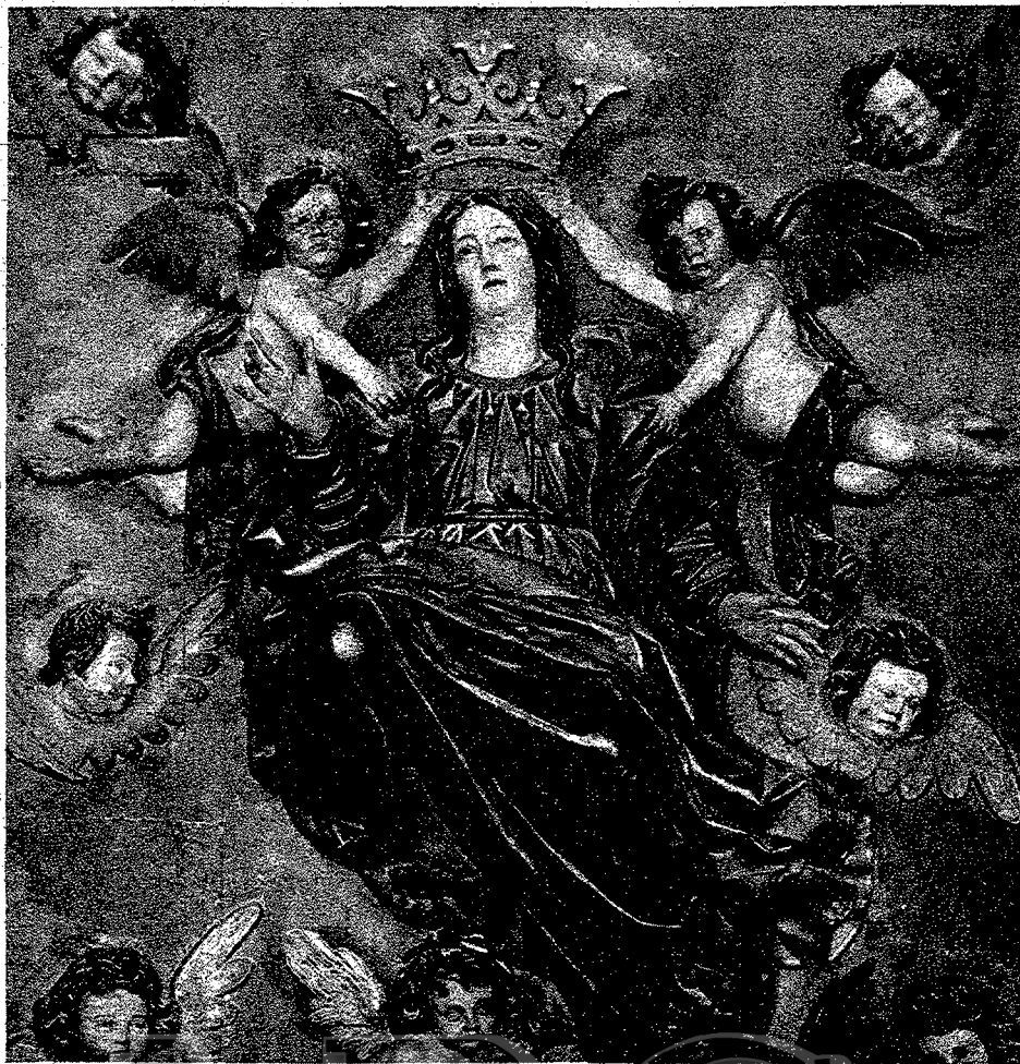
"LA ASUNCIÓN", ALTORRELIEVO DEL SIGLO XVII. CONVENTO DE LA CONCEPCION, DE LEBRIJA

noce por la de la Leche. Fué donación del Rey San Fernando a las monjas del convento de San Clemente, que él mandara fundar cuando la conquista de Sevilla. Es una primorosa imagen de pequeño tamaño, asegurándose de ella que muchas veces la llevó el Monarca conquistador sobre el arzón del caballo que montaba. Es de alabastro policromado.