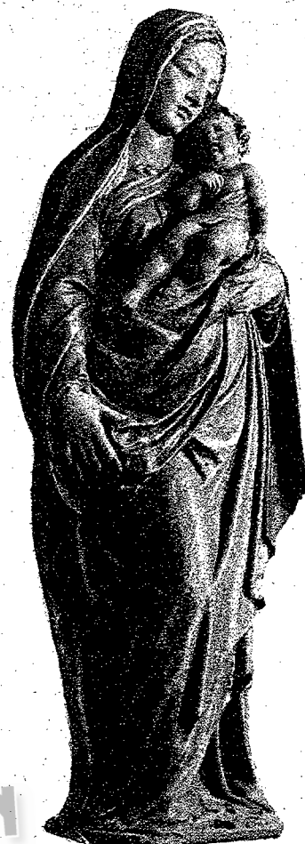
"LA VIRGEN DE LAS FIEBRES", QUE SE ATRIBUYE A TORRIGIANO