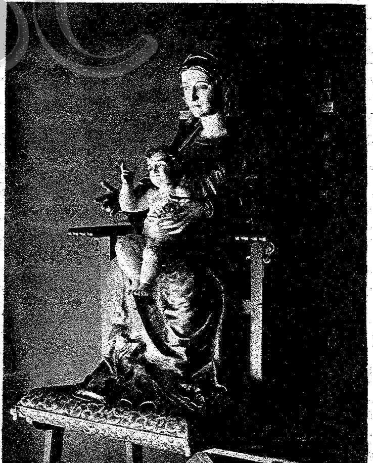
"LA VIRGEN DE LA VICTORIA", DE LA PARROQUIA DE SANTA ANA, DE TRIANA