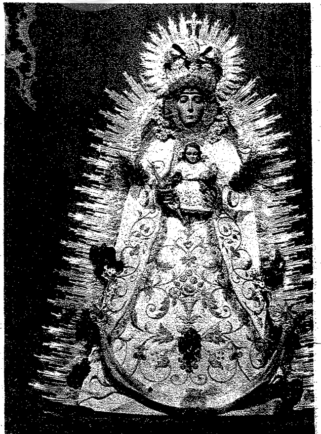
DERECHA: LA VIRGEN DEL ROCIO EN LA PARROQUIA DEL SALVADOR, DE SEVILLA