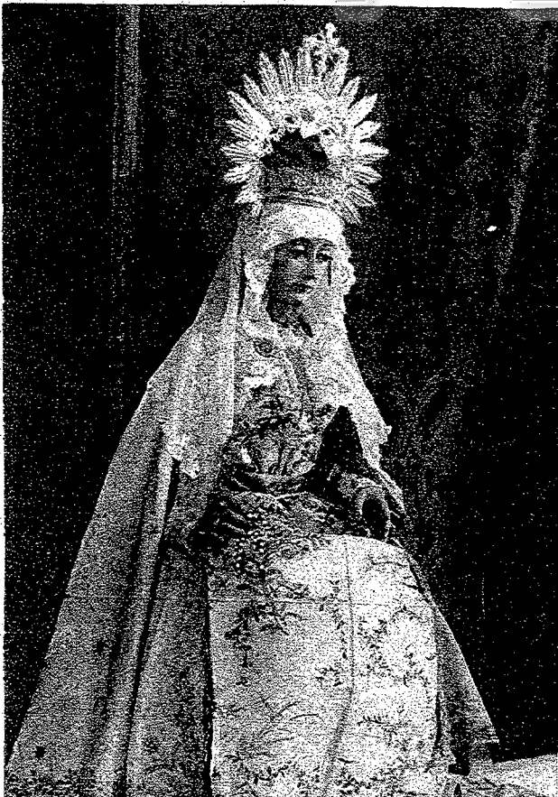
EL PASO DE LA COFRADIA DE LA VIRGEN DE LA ESPERANZA, DE TRIANA