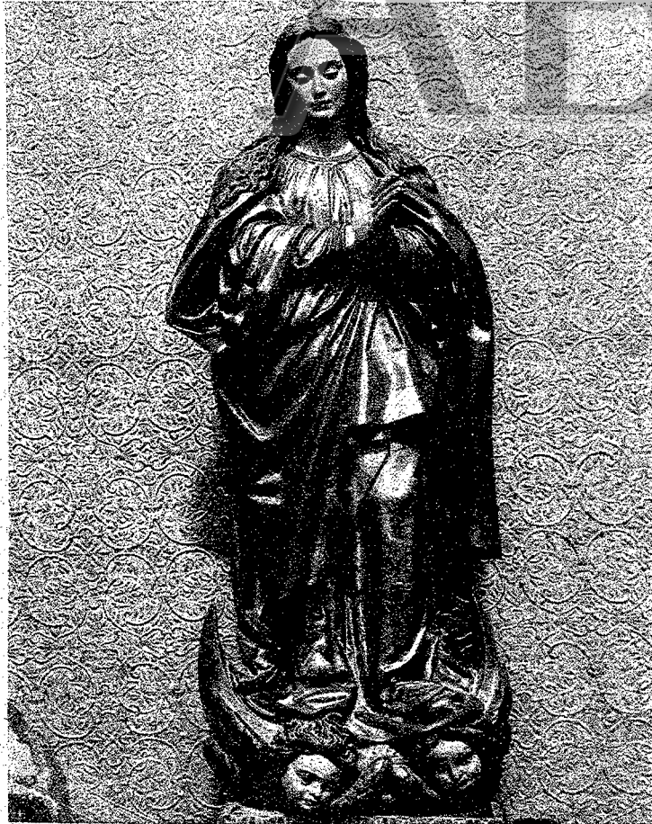
"PUREZA", DE MONTAÑÉS. CONVENTO DE SANTA CLARA, DE SEVILLA

De la misma manera es hermosa la Virgen de las Nieves, del pueblo de Alanís. Es gótica, del siglo XV.