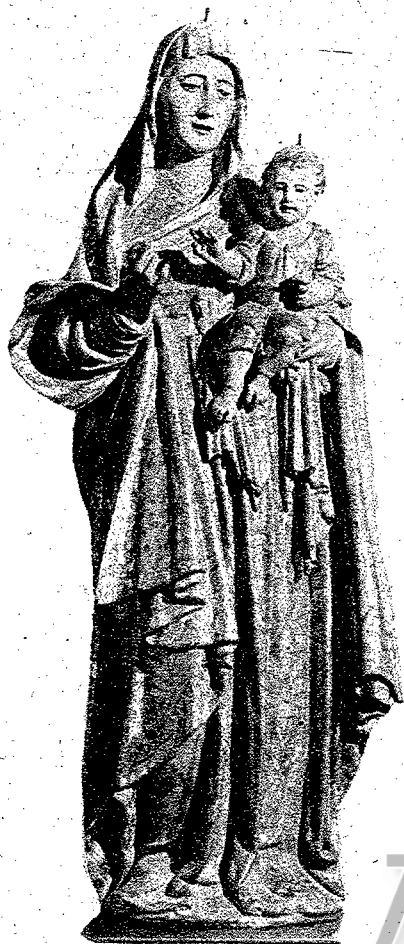
"LA VIRGEN DE LA MISERICORDIA", POR ROQUE BALDUQUE (1552)

Nuevamente ha abierto sus puertas al público, renovados sus cuadros, esculturas, orfebrería y bordados, la maravillosa Exposición Mariana, de Sevilla, siendo hasta tal punto diferente de la que se inauguró con motivo del inolvidable Congreso Mariano, que puede afirmarse que la actual es una Exposición distinta.